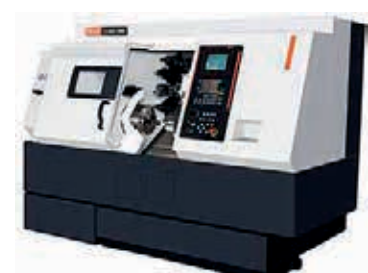
4Mazak Quick-Turn Nexus 250-II MS