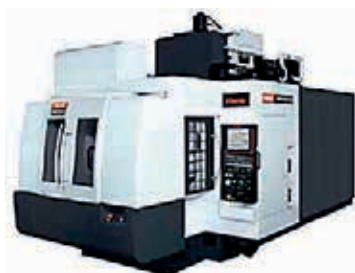
Mazak Variaxis 630 II