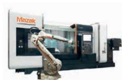
Mazak Integrex i-200ST-1500